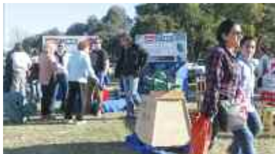
La feria estará abierta de 10 a 20 horas, los tres días, con entrada libre y gratuita, y el viernes 1º será el día destinado a visitas escolares.

Habrá también espacios para una propuesta educativa y la feria de ciencias, como así también para la industria cultural, además de una participación especial de cervecías artesanales, una actividad que muestra un interesante crecimiento en Río Cuarto.