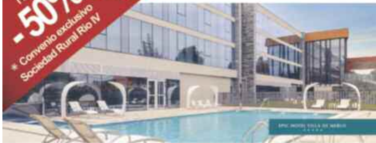
EPIC HOTEL VILLA DE MERLO ★★★★