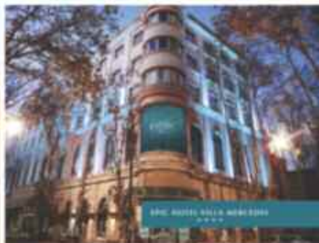
EPIC HOTEL VILLA MERCEDES ★★★★