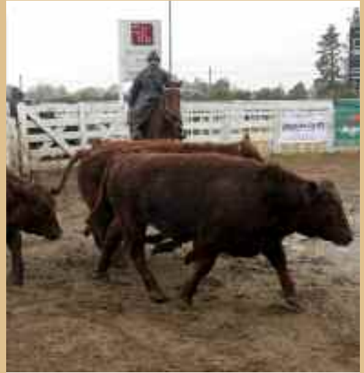
Ganaderos de punta volverán a presentar sus animales en el Concurso de Novillos Terminados que se hará el 6 de junio.

Las inscripciones se realizan en la firma consignataria.