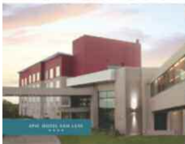
EPIC HOTEL SAN LUIS ★★★★