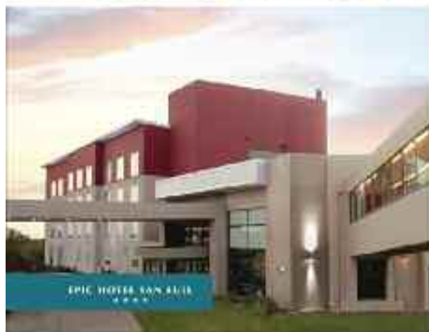
EPIC HOTEL SAN LUIS *****