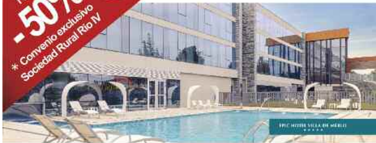
EPIC HOTEL VILLA DE MERLÚ *****