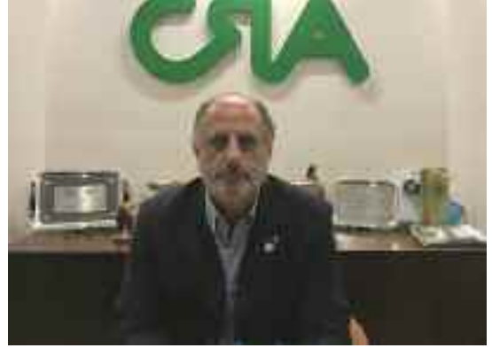
Jorge Chemes, presidente de CRA.

“Esto debe ser acompañado por un alivio de la presión impositiva agobiante que sufre la ciudadanía en su conjunto, como así también, la necesidad de disminución del gasto político, dando de esta manera señales en el sentido correcto”.