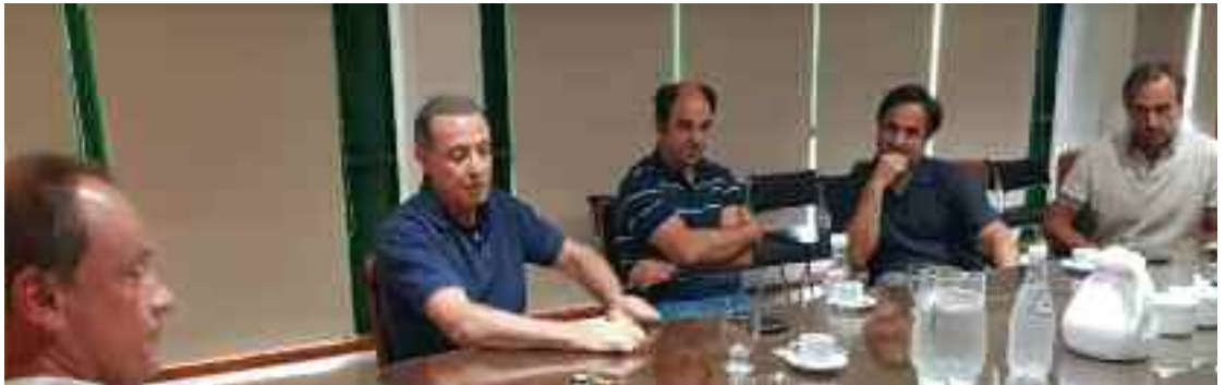
Invitado por Cartez, el titular de la regional Córdoba del Senasa se reunió con productores en nuestra entidad.

porque la presencia evita difusiones de enfermedades.