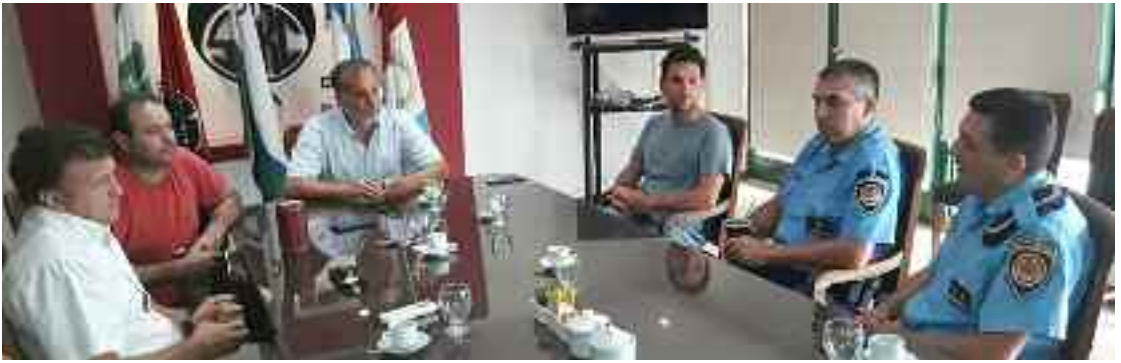
Los directivos de la Rural recibieron a la cúpula de la Patrulla.

tales por los que se creó la Patrulla Rural, para tratar de evitar los hechos delictivos que se estaban cometiendo en la zona”.