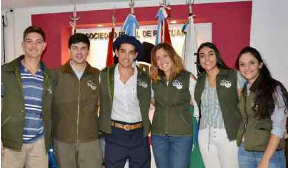
Los integrantes de la nueva conducción del Ateneo Juvenil.