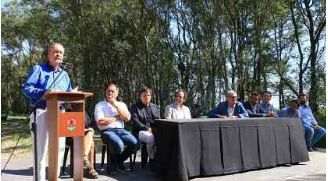
El gobernador Schiaretti durante la habilitación de las obras de enripiado.