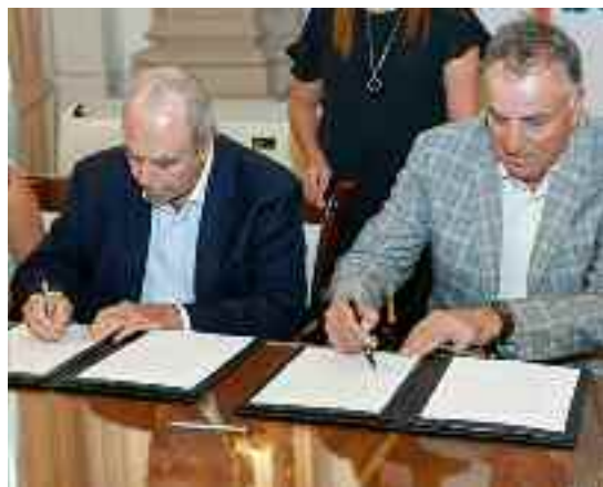
El Gobierno provincial firmó con el Banco de Córdoba el Fideicomiso para el Desarrollo Agropecuario.