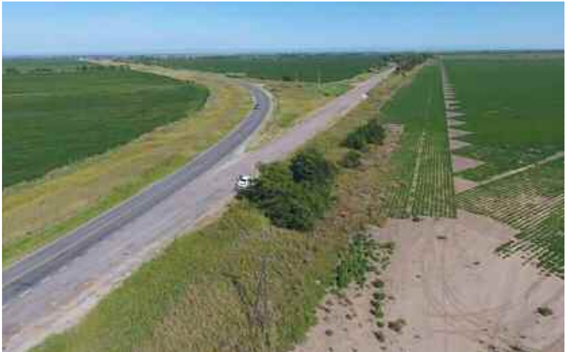
El programa de mejoramiento de caminos rurales se puso en marcha con el Camino S266.

La inversión, que fue de 15.700.000 pesos, beneficiará a los productores de la zona, ya que este camino comunica un gran centro de producción