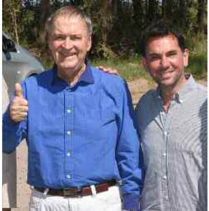
El gobernador Schiaretti junto a Franco Mugnaini, inspirador del proyecto de enripiado de los caminos rurales.

"Tenemos carteles que dicen máxima 60 kilómetros por hora, el camino está pensado y diagramado para no excederse de esa velocidad, por eso pedimos prudencia en cualquier camino de tierra porque un vehículo a más de 80 kilómetros por esos caminos es inestable y peligroso", completó.