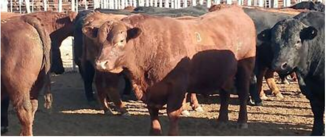
Los Angus, con una recria a campo, sin confinamiento y con base pastoril.