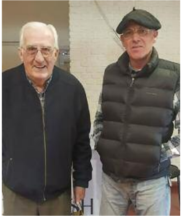
Los Zuza, tradición y pasión por la ganadería.

El precio promedio de los toros rondó los 220 mil pesos y el de las hembras 115 mil pesos.