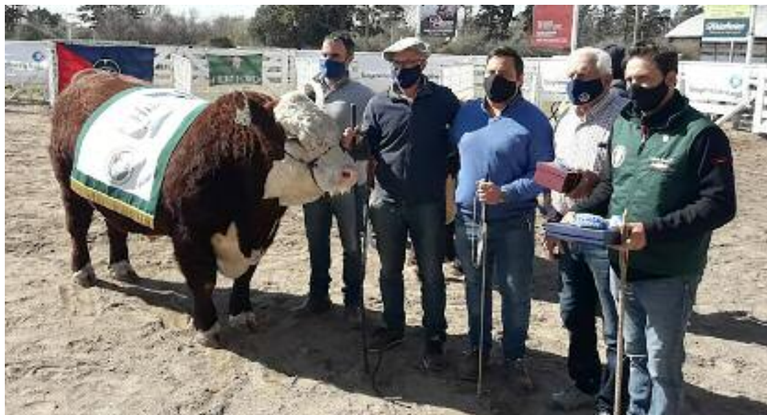
El gran campeón Hereford fue presentado por una sociedad entre tres cabañas de nuestra región.