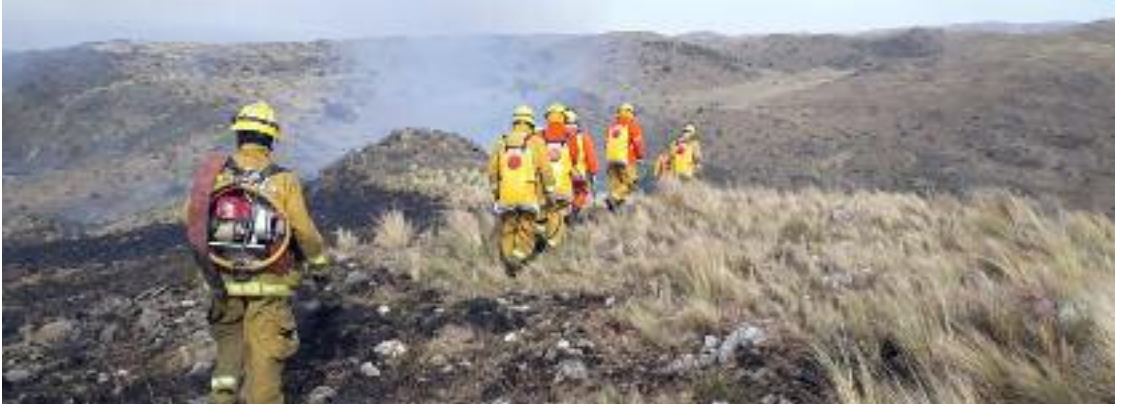
Los incendios fueron devastadores en la zona serrana del sur provincial.