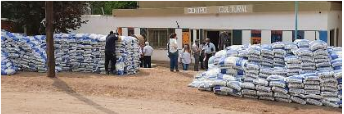
La ayuda de la Sociedad Rural y del Gobierno provincial llega a los productores.

Sobre la estimación de la mortandad de animales, el productor consideró que cuando estén los datos a través de la UEL “creo que vamos a tener un 20 por ciento menos de hacienda que en años anteriores”.