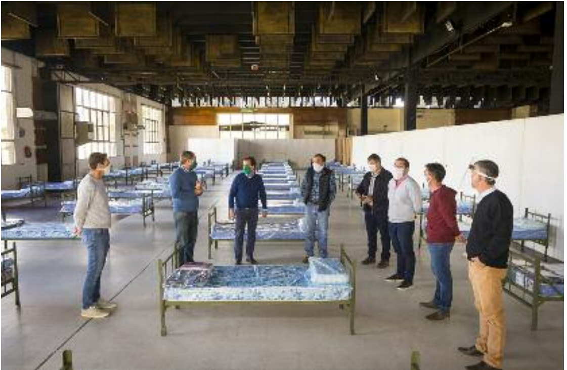
El salón central de la Rural se convirtió en un centro de aislamiento.

Varias instituciones de la ciudad colaboraron con los equipos de salud y contaron con el aporte de empresarios y particulares, estrechando vínculos con la comunidad