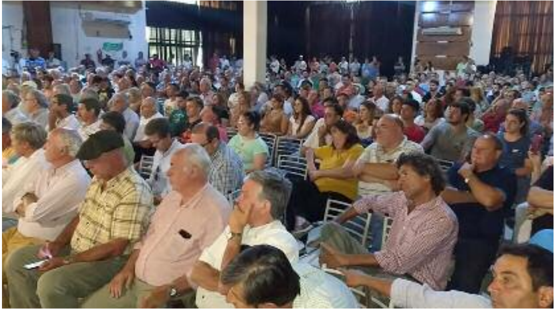
La Rural de Río Cuarto albergó a la mesa de Enlace Nacional en una asamblea de productores contra la suba de los derechos de exportación.

estructura, que son las que se necesitan para poder sacar la producción y que los campos realmente puedan producir a su máximo esplendor. El Gobierno está para gobernar y los impuestos son imposiciones, pero sí es verdad que el Gobierno de Córdoba está consultando y hay un diálogo permanente de la Mesa de Enlace provincial con ellos.