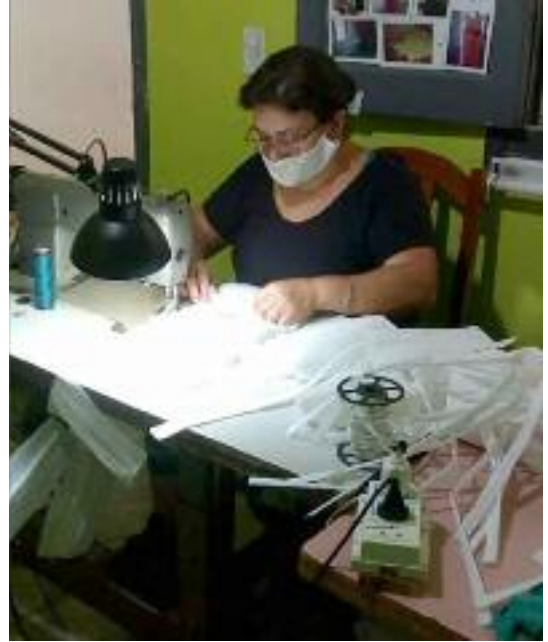
La campaña de “costureras solidarias” tuvo una amplia repercusión.

Por otra parte, el salón principal de la Rural fue acondicionado para un centro de aislamiento y fruto de la articulación público-privada se montó toda la logística para instalar 100 camas en un espacio dividido para hombres y mujeres, con baños, duchas y comedor, todo en función de lo