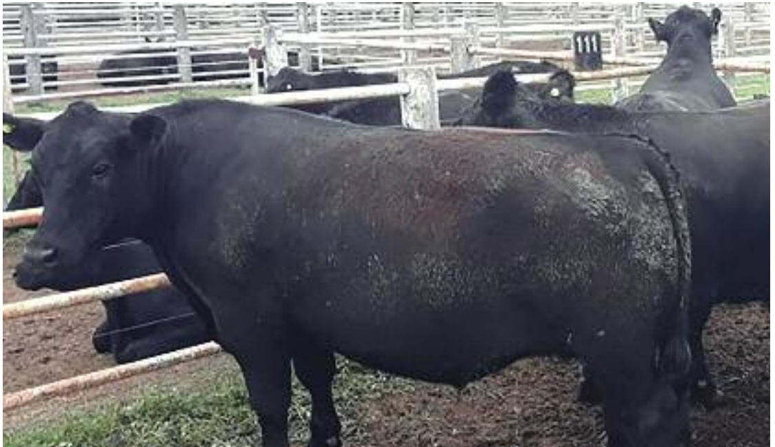
El premio en novillos pesados se lo llevó Ludovico Meneghello.