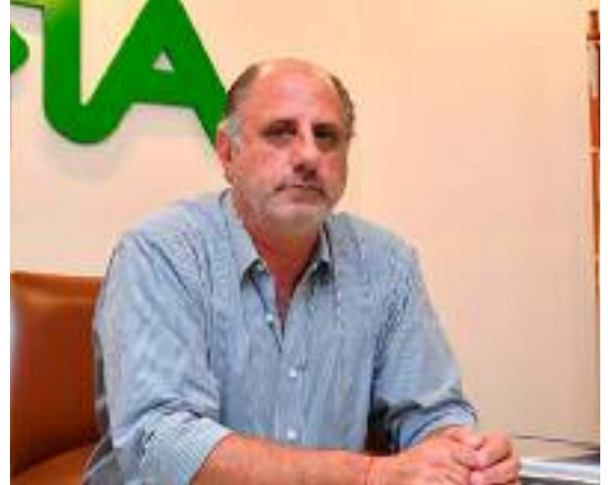
Chemes: "En el balance hay un gran rojo del Gobierno".

La lapicera de la política fue veloz a la hora de trazar proyectos que desnudaron la ignorancia que tienen sobre cómo se trabaja en el campo. Abundan en este año los tristes ejemplos que tuvieron como