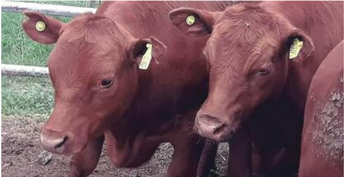
La familia Elowson presentó los mejores novillos livianos.