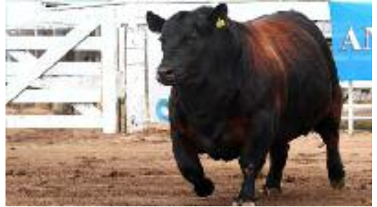
Pese a la pandemia, se pudo realizar la Exposición Ganadera, con una excelente calidad de reproductores.

- Sin dudas que es así, el productor es un optimista por naturaleza y por más que las cuentas no den cuando llueve la sembradora sale y siembra. Es parte de lo que el Gobierno tiene que entender, no podemos estar sembrando con una regla de juego, en enero la cambian cuando ya está todo sembrado y en marzo si viene todo más lindo la vuelven a cambiar. Por lo menos necesitamos reglas de juego claras por 3, 4, 5 años, para que si tenemos que hacer una inversión importante en una sembradora, en una cosechadora, en