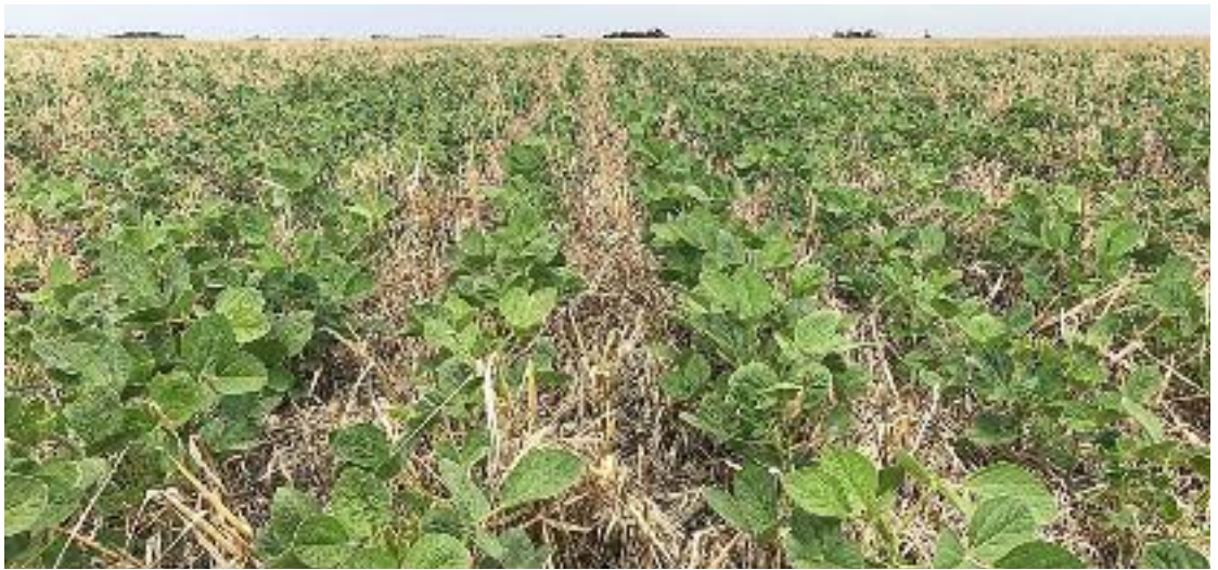
La soja presenta un buen estado en general, según la Bolsa de Cereales.

la producción crecería significativamente por el aumento de superficie. Se esperan 371.200 toneladas.