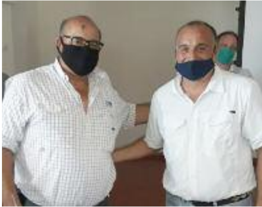
El presidente de la Rural, durante la entrega de incentivos a los productores.