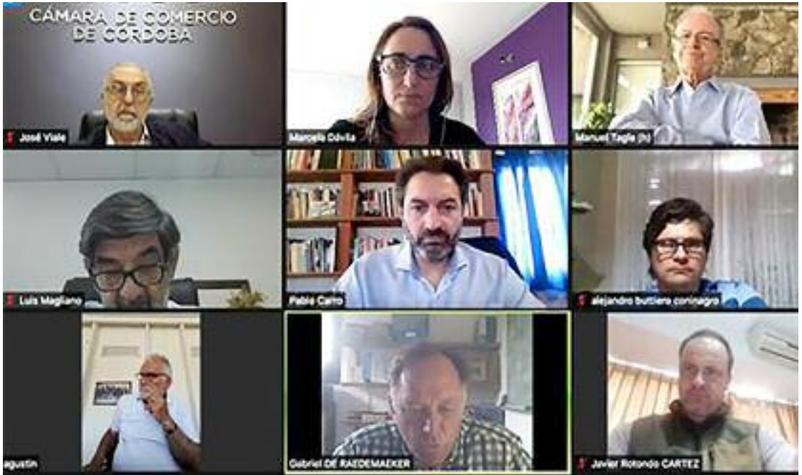
La Mesa de la Producción advierte sobre el rumbo económico.

La Mesa de la Producción afirmó que las medidas del Gobierno siembran incertidumbre y alejan aún más la perspectiva de una pronta recuperación. A su vez, el ministro de Agricultura había calificado como “desacertada” la decisión de cerrar las exportaciones de maíz