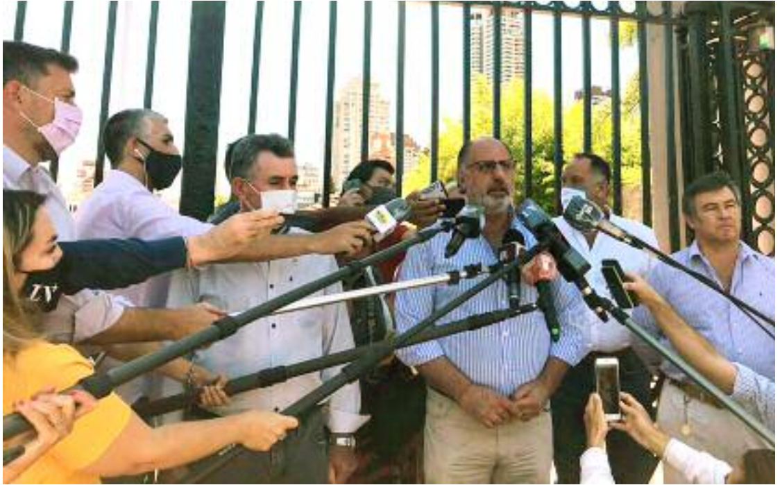
La Mesa de Enlace nacional anuncia el final del cese de comercialización tras levantarse el cepo a las exportaciones de maíz.