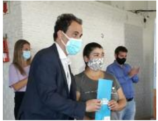
El intendente Llamosas participó del acto que se realizó en la Rural.

beneficiario y también la explicación del sistema de puntajes y las condiciones que deben cumplirse para la validación de cada una de las prácticas.