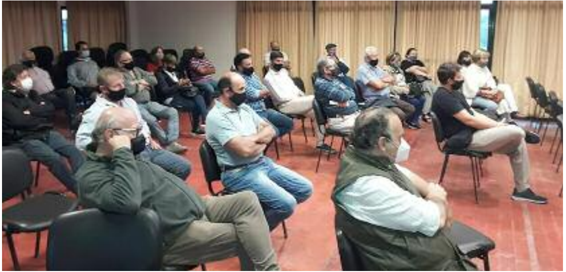
Miembros de la Comisión Directiva y productores, de manera presencial y virtual, participaron de la asamblea que se realizó en nuestro predio.

de un globo de ensayo para ver hasta dónde se podía avanzar en esta escalada para cerrar cada vez más la economía.