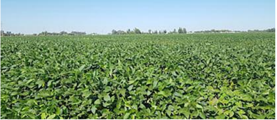
Las buenas precipitaciones de enero potencian los rindes en la soja.

En nuestra región se augura una buena cosecha de maíz y soja. También la siembra de sorgo creció fuerte y no alcanzaron las semillas. El girasol recupera hectáreas