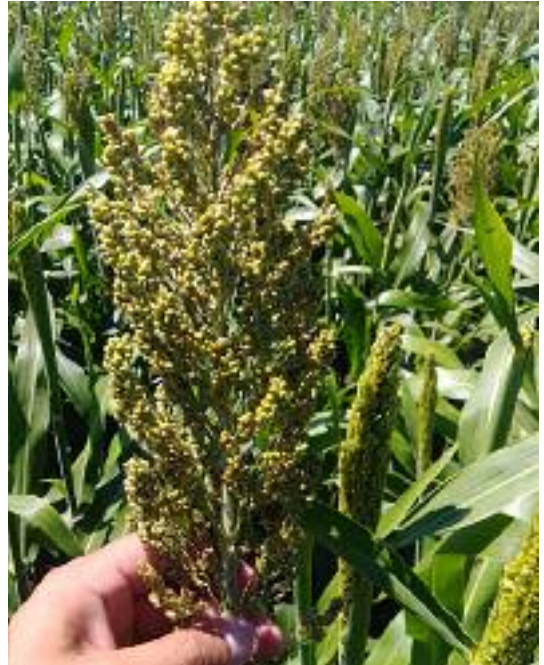
En el sur provincial y en San Luis el sorgo gana terreno.

“Muchos se han volcado al sorgo y lo mismo ha