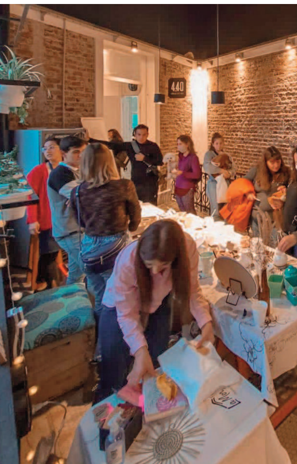
Emprendedores de los más diversos rubros participarán de la Feria Paseo Rural.

de junio, la Feria Paseo Rural organizada por