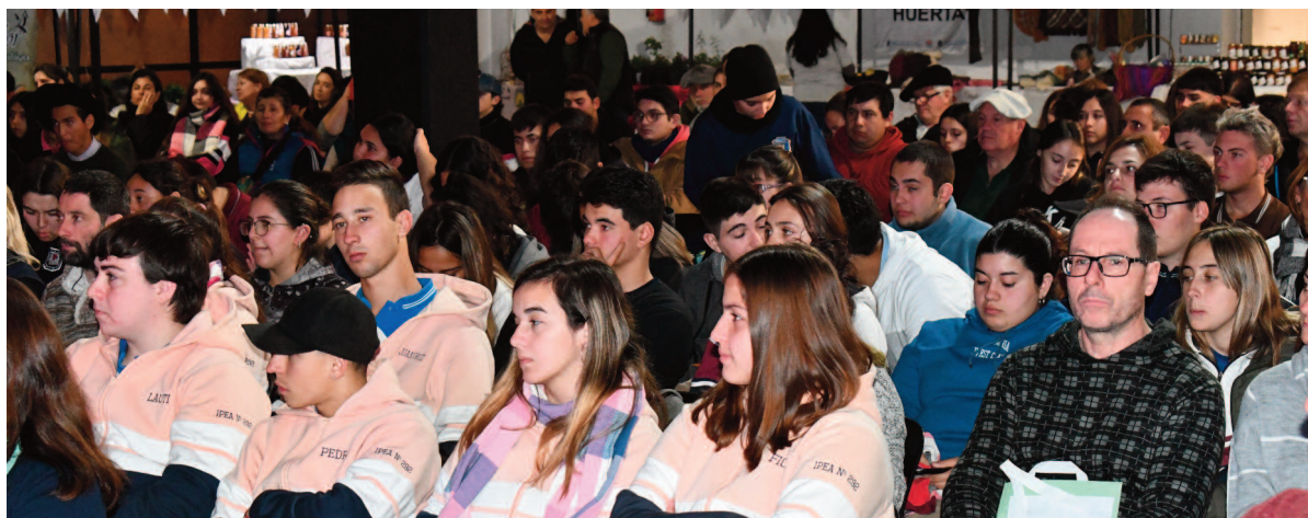
La 70ª Expo de Otoño suma cada año actividades, entre ellas, numerosas charlas y capacitaciones.

el año pasado, para participar de alguna de las tres pruebas, Aparte Campero, Felipe Z Ballester o Roberto J Dowdall, hay que entrar en la página web de la Asociación de caballos criollos, crearse un usuario, ingresar y buscar el apartado exposición funcional de Río Cuarto y elegir una de las tres disciplinas para inscribirse y poder competir”.