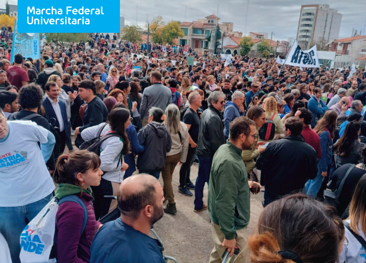
Marcha Federal Universitaria del 23 de Abril en Río Cuarto.