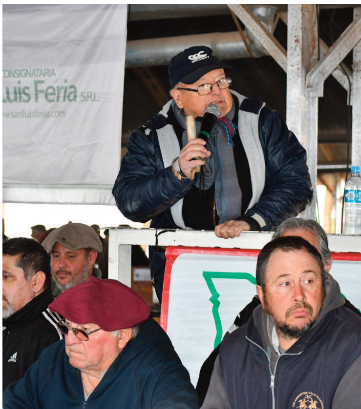
La consignataria "San Luis Ferias" un año más acompaña los remates de la exposición de otoño de la Rural.

La invitación está hecha, la fecha definida, del 27 de mayo al 2 de junio próximos, la Rural de Río Cuarto espera a sus visitantes para disfrutar de una multitud de propuestas de actividades que buscan que nadie quede afuera, al contrario, que todos se sientan convocados.