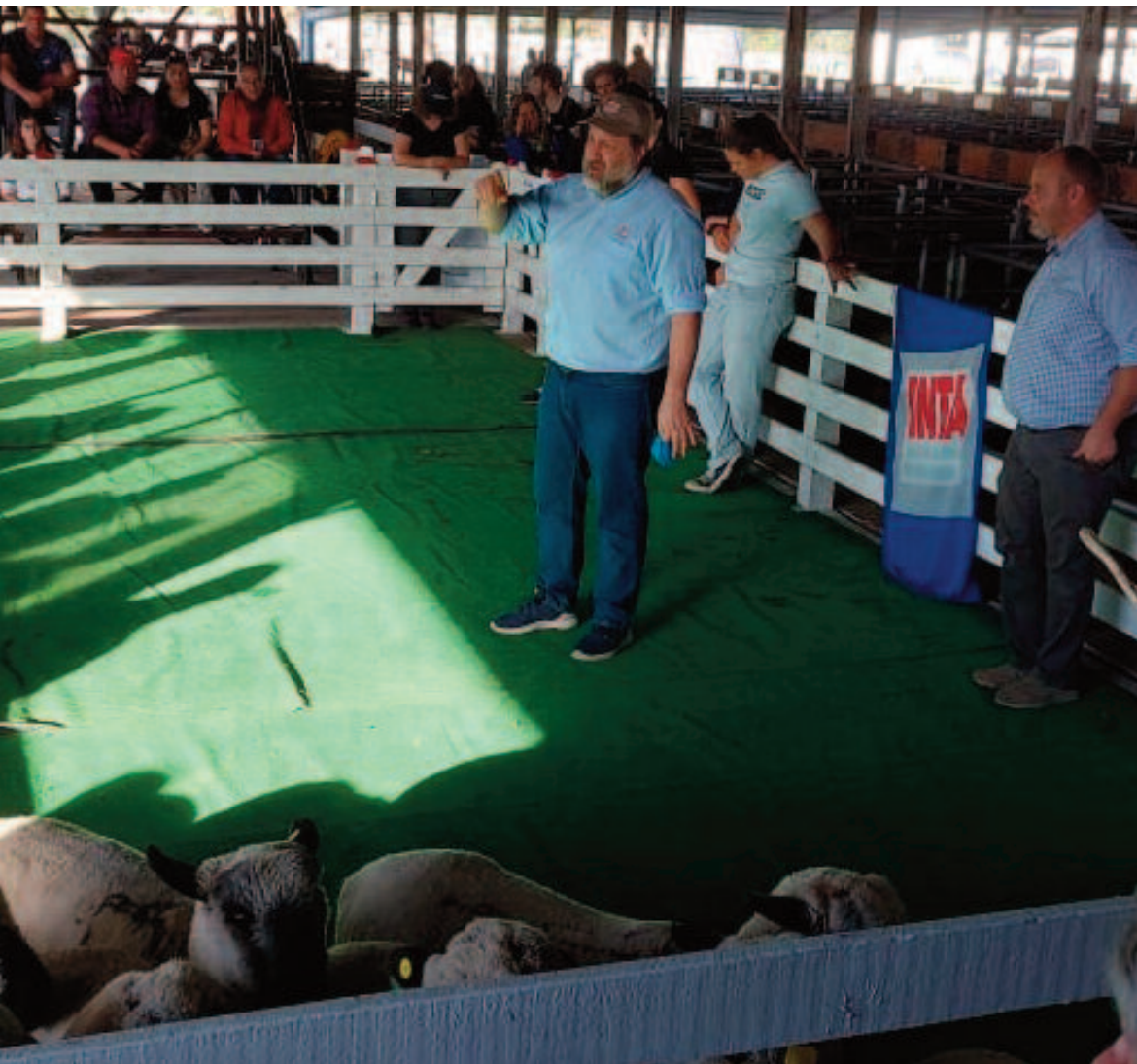
Momento de prácticas ovinas en los corrales del predio ruralista.

ruptivo, para generar discusión, para abrir la mente y para seguir conversando a futuro.”